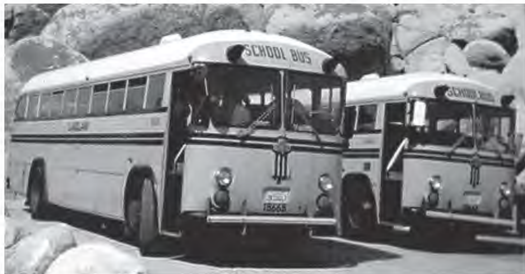
The CROWN-buses in their home country „California“

von bis zu 55 Personen (hierbei fahren wir mit 2 Bussen parallel) alles abdecken.